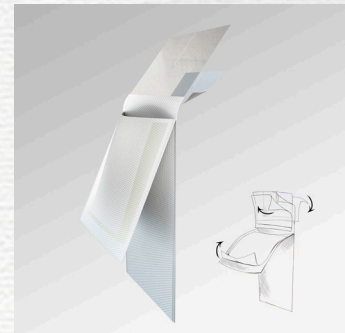
پانسماں نقره‌دار کتتر با کیسه محافظ (Exit Pocket Ag)